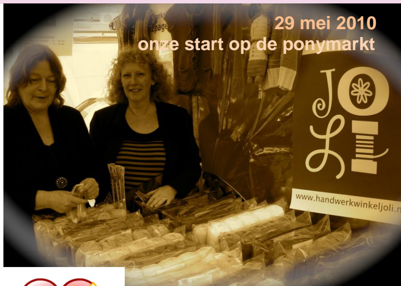
29 mei 2010 onze start op de ponymarkt