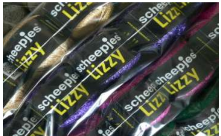
U hebt keus uit een ruime collectie Scheepjeswol

Het hele jaar geven wij op zaterdag 10 procent korting aan leden van de ANBO en PCOB. Deze korting geldt ook voor leden van Bibliotheek Hoeksche Waard en bezitters van een Zorgwaard Pluspas. De korting geldt niet in combinatie met andere acties en alleen op vertoon van de bijbehorende pas. Houd dat zelf in de gaten!